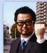
2019年 神奈川経営研究会 会長

平成最後の全国大会を通して、ご参加して頂いた皆様に元気になって頂きたいです。業績向上のヒント、新たなビジネスモデルのヒントが皆様に一つでも多く伝わる全国大会に必ずしていきます。神奈川経営研究会と副主管の熱意をあなたの目で是非ご確認ください。