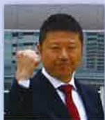
日創研経営研究会 全国大会 in 神奈川2019 実行委員長